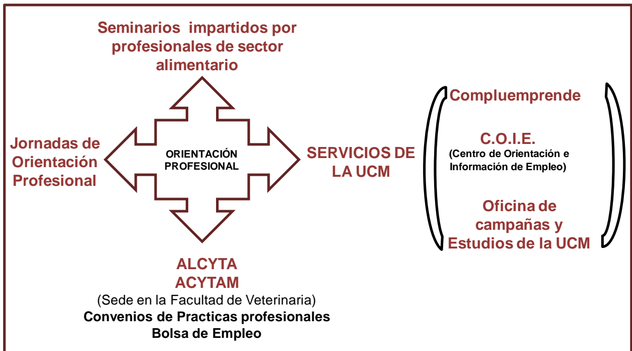
EV5.1. Figura 2. Principales servicios de orientación profesional.